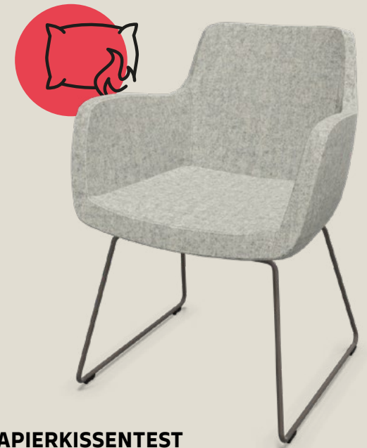
PAPIERKISSENTEST DIN 66084 P-a

Der Streichholztest prüft das Verhalten bei offener Flamme und stellt höhere Anforderungen an das Material.