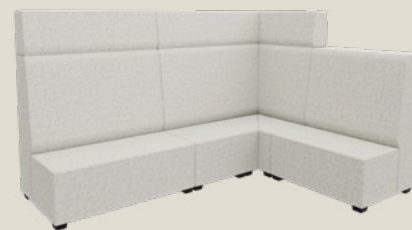
Talkline Protect-F & Talkline Hochbank Protect-F