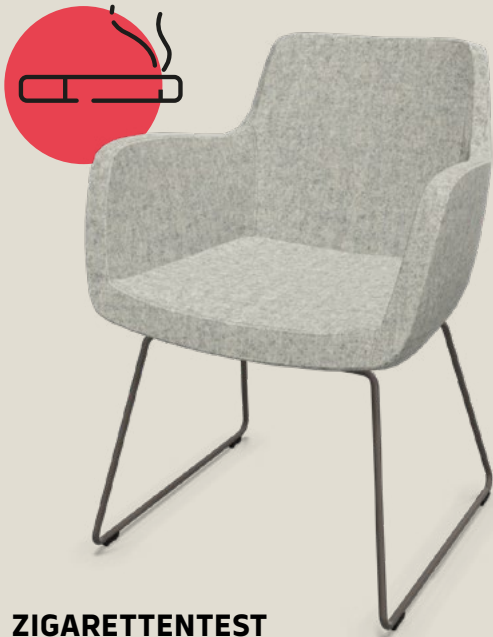
ZIGARETTENTEST DIN 66084 P-c

Beim Brandschutz von Polstermöbeln hält sich hartnäckig der Irrtum, eine B1-Zertifizierung reiche aus. Doch B1 bewertet ausschließlich einzelne Baustoffe und lässt sich nicht auf komplette Polstermöbel übertragen.