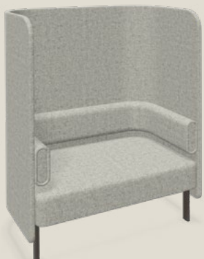
Febrü Aura Protect-F