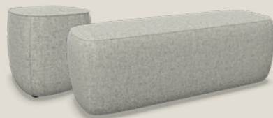
Bobb & Bobb duo Protect-F