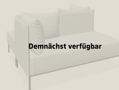
Elements Protect-F (ohne Holzkorpen)