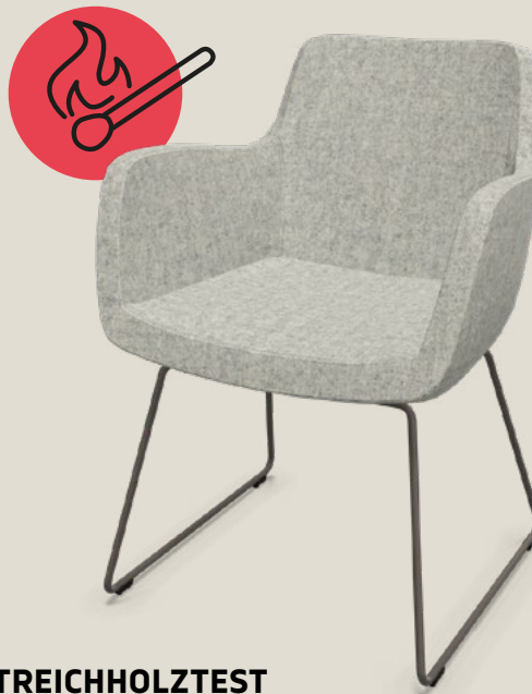
STREICHHOLZTEST DIN 66084 P-b

Der Zigarettentest prüft das Verhalten bei Schwelbrand.